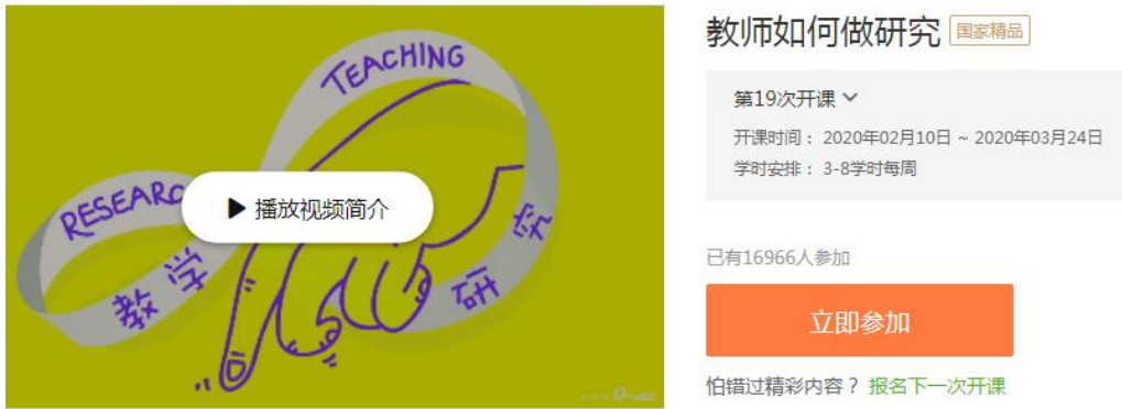
图 3 教师如何做研究课程

点击上图 3 中的立即参加即可进入学习第 19 次开课课程内容，另外选择查看往期课程即可看到所有课程，如下图 4 所示。