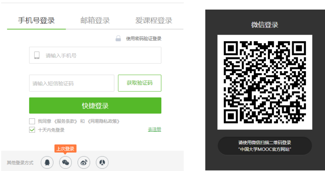
图 1 注册登录界面

点击中国大学 mooc 慕课平台官网链接 https://www.icourse163.org/ ，选择注册新用户或者直接登陆已有账号。建议使用手机号快捷登录，或者直接采用 QQ\微信扫码登录，如下图 1 所示。