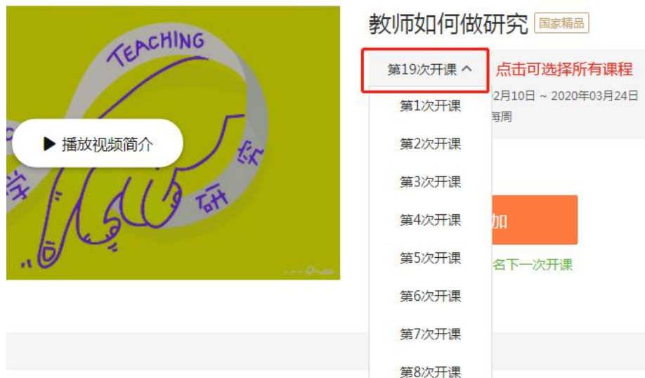
图 4 查看往期课程

点击上图 3 中的立即参加即可进入学习第 19 次开课课程内容，另外选择查看往期课程即可看到所有课程，如下图 4 所示。