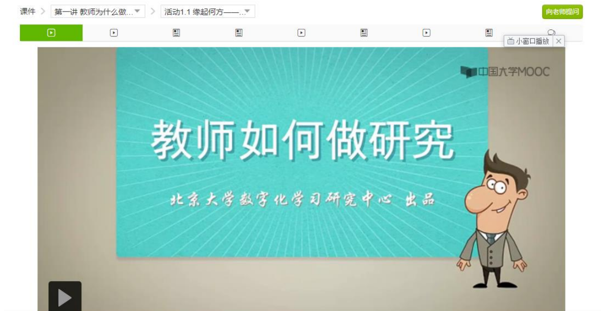
图 6 活动 1.1 学习界面

点击右侧导航中的 课件 ，随后点击相应课程内容即可按顺序进行学习，如下图所示 6 界面所示，用户可自行调整视频播放倍速。