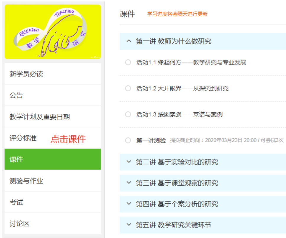
图 5 课程学习平台

点击右侧导航中的 课件 ，随后点击相应课程内容即可按顺序进行学习，如下图所示 6 界面所示，用户可自行调整视频播放倍速。